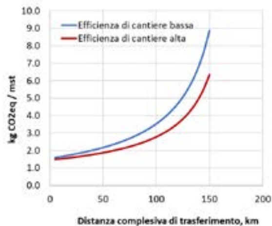
Figura 2: effetto dell'efficienza del cantiere e della logistica (ore di effettiva cippatura sul totale delle ore utilizzate dalla macchina inclusi i trasferimenti) sul totale delle missioni unitarie di CO 2 eq in relazione alle distanze di trasferimento della cippatrice. A una distanza di 50 km percorsa per il trasferimento (andata e ritorno) della macchina, l'incidenza di emissioni per unità prodotta in cantieri con efficienza bassa (60%) può essere +16% (circa 0.3 kgCO 2 eq/mst e circa 1.18 kgCO 2 eq/t per cippato di abete rosso con contenuto idrico 40%) rispetto a un cantiere di cippatura con alta efficienza (90%).

I primi risultati confermano che le principali criticità del processo di produzione del cippato forestale e della logistica dei cantieri di cippatura riguardano l'accesso ai piazzali di lavorazione, i ridotti spazi di manovra, la distribuzione frammentata, la collocazione e le dimensioni delle cataste della biomassa. Queste condizioni diventano ancora più complesse in aree